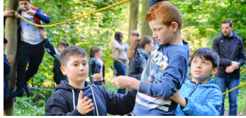
WALDJUGENDSPIELE Kinder entdecken bei Waldjugendspielen die Natur im Team