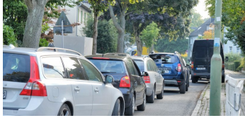
VERKEHRSSCHAOS Haltestellen-Umbau sorgt für Verkehrschaos in Huttrop