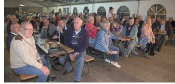
BÜRGERVERSAMMLUNG In Haarzopf fehlen Seniorenwohnungen und Schulplätze