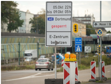
ESSEN Baumaßnahmen auf der A40 im Oktober